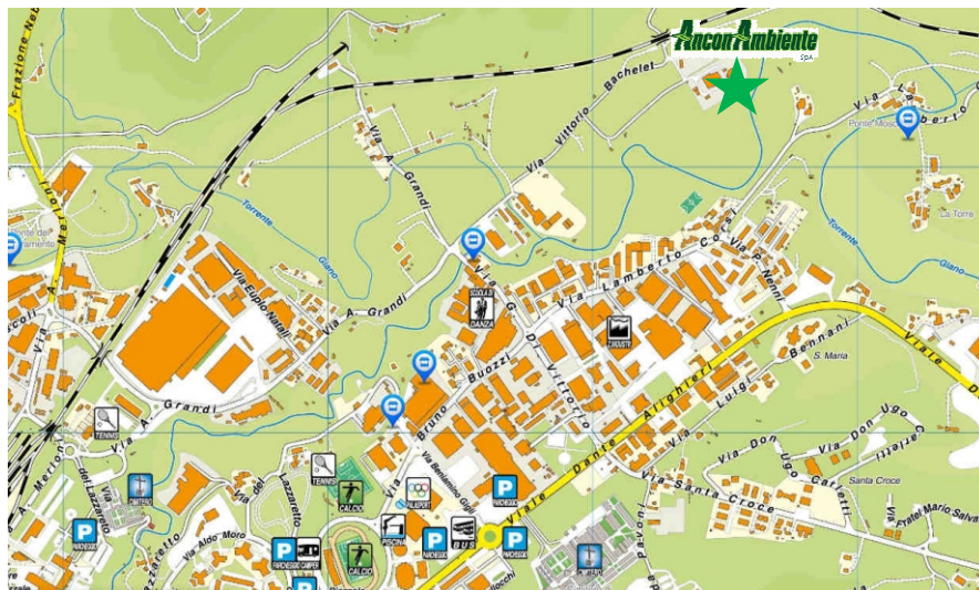
La stella nella piantina indica il CentraAmbiente