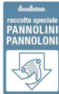
Figura 1- logo pannolini e pannoloni

L'AnconAmbiente, ricevute la richiesta da parte dell'utenza, provvederà alla fornitura gratuita di 60 adesivi con logo apposito per il tipo di raccolta da attaccare al sacco da conferire.